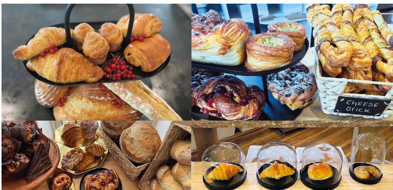
Pains et pâtisseries qu'on retrouve pendant quatre jours par semaine au café.

Si Kirsten fait la plupart du travail, il fait un peu de pain pendant la semaine, car il travaille à temps plein pour Anciens combattants Canada. Le café est